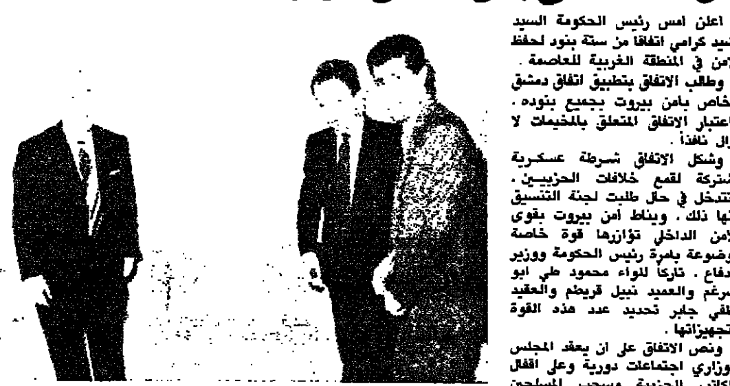
كرامي مع حمدة ويبيون في منزله امس (اسماعيل حمدان)

اعلن امس رئيس الحكومة السيد رشيد كرامي انفاقاً من ستة بنود لحفظ الامن في المنطقة الغربية للعمامة. وطالب الاتفاق بتطبيق انفاق دمشق الخاص بامن بيروت بجميع بنوده. واعتبار الاتفاق المنعلق بالمخيمات لا يزال نافذاً. وشكل الاتفاق شرطة عسكرية مشتركة للتعامل مع حالات التنسيق وتدخل في حال طلت لجنة التنسيق منها ذلك. ويطلب امن بيروت بقوى الامن الداخلي توازرها قوة خاصة مخصصة لمرور رئيس الحكومة ووزير الدفاع. ثانياً اللواء محمود طي ابو ضرع والمعمد نبيل قريطم والقائد لطفي جابر حنيدع هذه القوة وتجهيزاتها.